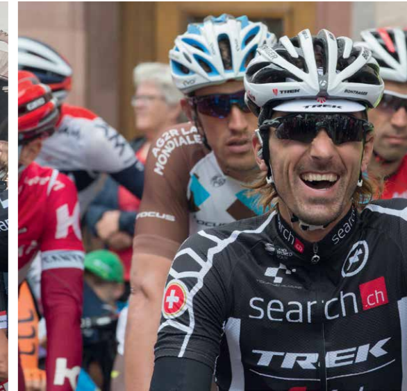
Impressionen «Rheinfelden – Etappenort der Tour de Suisse»